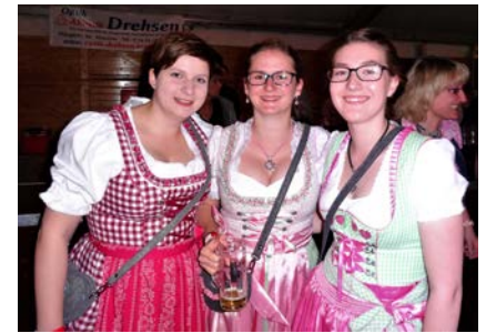
Drei unserer Mädels im feschen Dirndl

gewohnt zünftiger Weise die Stimmung im Zelt an. In gelungenem Wechsel von Schlagern, Volksmusik und Bläserhits zeigte die Gruppe bis in die frühen Morgenstunden, wie sich das Zelt mit Live-Musik in eine fröhliche Partystimmung verwandelte. Bei gekühltem Bier und schmackhafter Bierzeltkost von den Obergeicher Spürälchen tanzten die Madeln in feschen Dirndl und die Buam in knackigen Lederhosen im Schlosspark von Merode. An diesen Erfolg möchten wir auch im nächsten Jahr anknüpfen: am 08.09.2018 findet das 5. BVM-Oktoberfest statt. Zu diesem Anlass stellt uns die Prinzenfamilie freundlicherweise wieder ihren Schlosspark mit der wunderschönen Kulisse des Schlosses zur Verfügung.