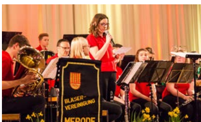
Ein Teil des JBO während des Konzertes