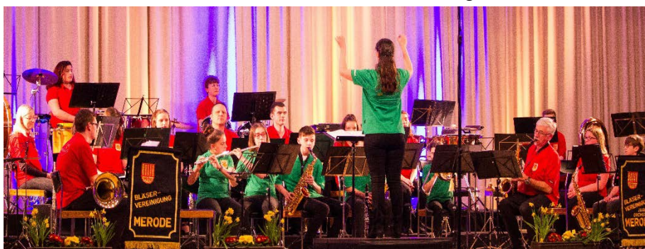
Die Musiker des Jugendorchesters und des Instrumentalkreises auf dem Jahreskonzert 2017