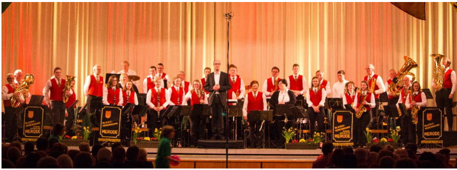
Die Musiker des Hauptorchesters auf dem Jahreskonzert 2017