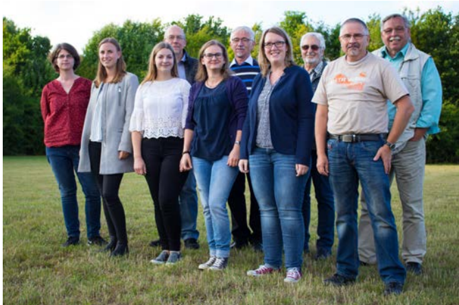
Seit März 2017 hat die BVM einen neuen Vorstand

Sie haben richtig gesehen, die BVM-Info ist wieder da. In neuem Outfit erhalten Sie dieses Mal die Infos rund um die BVM in Form eines Jahresrückblicks. Auch im bald endenden Kalenderjahr haben wir viel erlebt und geschafft. Als eines der ersten Ereignisse dieses Jahres haben wir im Frühjahr einen neuen Vorstand gewählt. Herausgekommen ist eine gute Mischung aus jungen Musikern und langjährigen, erfahrenen Mitgliedern.